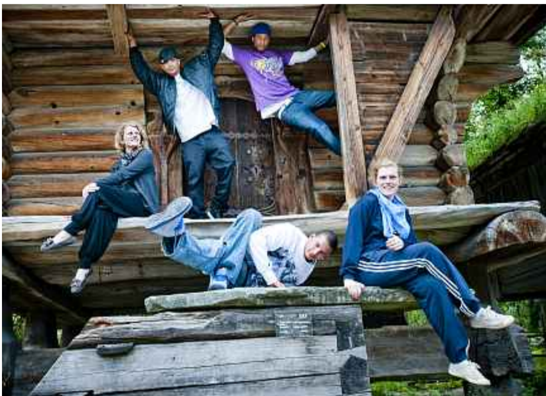
BRA GJENG: Blandingen hip hop, folkedans og fele funker så det suser. Ungdommene tilhører Den mangfoldige scenen.